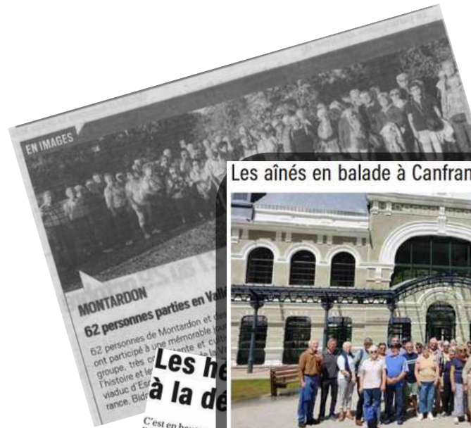
Les aînés en balade à Canfranc et