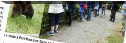
La visite à Parc'Ours a vu Diego se dresser

Vendredi 28 juin, les clubs des aînés Lou Tuc 6 l'Oursoo de Bonnut et Toustem Youens de Saint-Boès ont organisé une sortie à Canfranc. 60 participants ont pris le bus en direction de la gare d'Oloron-Sainte-Marie ; le guide de l'office du tourisme a rejoint le groupe pour un trajet en train jusqu'au terminus de Bedous. Durant ce voyage, le guide a captivé l'auditoire avec l'histoire fascinante de la ligne transpyrénéenne. Sous un soleil radieux, le groupe a découvert la gare monumentale de Canfranc. Cet édifice imposant, long de 214 mètres et désormais occupé par un hôtel 5 étoiles, est un superbe exemple d'architecture industrielle de l'époque. Le guide a partagé de nombreux détails intéressants sur cette gare emblématique, impressionnant les visiteurs par sa grandeur et son histoire. Le déjeuner a été pris au restaurant des Voyageurs à Urdos. L'après-midi, les aînés ont visité l'église, le cloître Notre-Dame-de-la-Pierre à Sarrance, et l'écomusée avec sa mise en scène originale et sa belle collection d'objets anciens et traditionnels. Tous les participants ont été ravis de cette sortie.